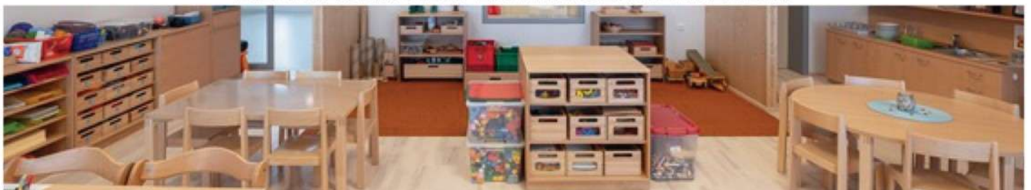
Text & Inhalt: TBE

WIR FREUEN UNS AUF IHRE ANMELDUNGEN. BEI FRAGEN HELFEN WIR GERNE WEITER!