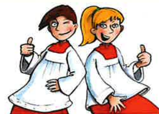
Neue Ministranten – Einladung